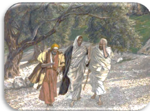
Rembrandt (1606- 1669)

++ Oremos a María para que los jóvenes acepten permanecer abiertos a la presencia de Dios en su proyecto de vida. 3 Alégrate ... Luego canto del verso: