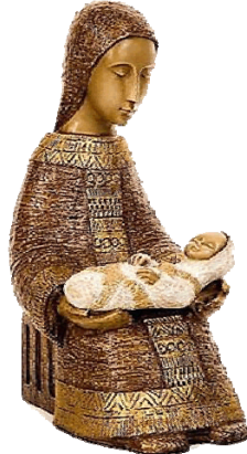
Comunidad St Gabriel La Hillière – Thouaré/Loire

"O san Montfort, amigo de Dios, Caminante de Nuestra Señora. Que para Jesús, tu corazón de fuego, Reanime en nosotros la llama."