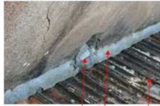
Photo 2 Trop plein mal positionné Chêne trop étroit Tuiles en mauvais état