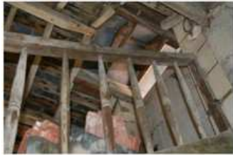
Photo 1 Mauvais état général des charpentes