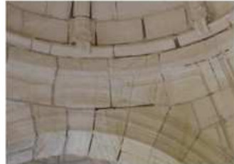
Photo 4 Joints abimés