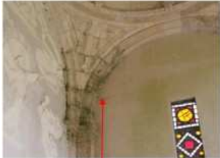
Photo 3 Trace d'humidité Purge et changement de pierres