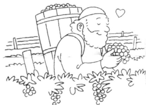
Mon Père est le vigneron. (Jean 15, 1)

Les fruits que le Seigneur attend de nous, ce sont des fruits de l'Évangile, ce sont des œuvres d'amour : aimer, c'est aussi le message de la 2 ème lecture de ce dimanche dans la 1 ère lettre de Saint Jean.